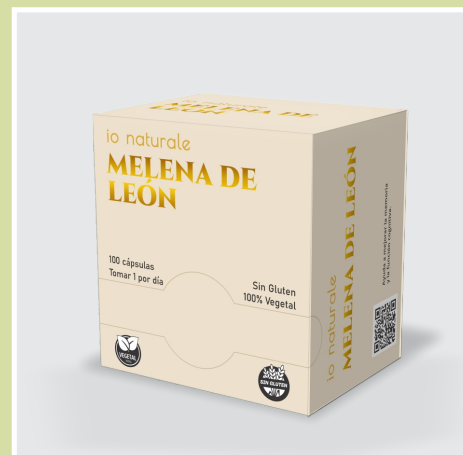
Melena de León

Aumenta la concentración y la función cognitiva. Antioxidante natural. Apoya la salud del sistema nervioso. Reduce el estrés y la ansiedad. Mejora la calidad del sueño. Estimula la regeneración neuronal. Protege el sistema digestivo regenerando mucosas y fortaleciendo la microbiota.