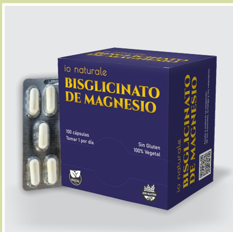
Bisglicinato de Magnesio

Reduce el estrés y la ansiedad. Promueve una mejor calidad del sueño. Fortalece el sistema inmunológico. Apoya la salud ósea y digestiva y cardiovascular. Regula los niveles de azúcar en sangre. Mejora la función muscular y nerviosa.