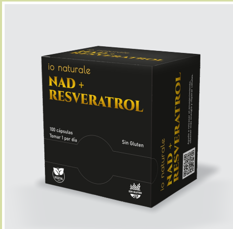
Nad + Resveratrol

Repara el ADN. Preserva la vitalidad celular y salud en general. Combate el estrés oxidativo y la inflamación. Fundamental para las reacciones metabólicas, aumenta la energía celular. Mejora la claridad mental, la circulación y el daño oxidativo de los vasos sanguíneos. Promueve la longevidad celular. Mejora la salud del corazón.