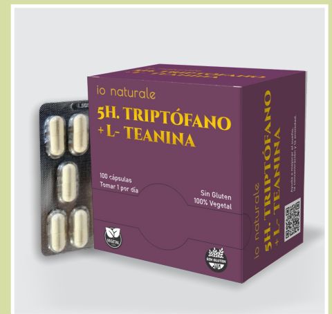
5H. Triptófano + L-Teanina

Ayuda a producir melatonina y serotonina. Mejora del estado de ánimo. Reduce los niveles de estrés. Promueve la relajación y la calma. Regula el ritmo circadiano y la calidad del sueño. Alivia síntomas de depresión y la ansiedad.