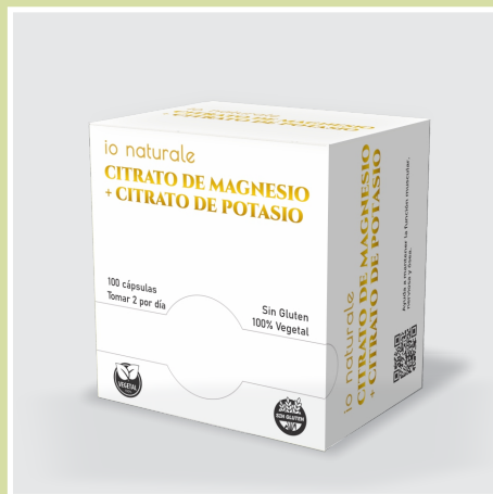
Citrato de Magnesio + Citrato de Potasio

Previene calambres musculares. El Citrato de Magnesio relaja los músculos. El Citrato de Potasio crucial para la contracción muscular y evita calambres. Ayuda a la salud ósea y regula los niveles de calcio. Apoya el metabolismo energético. Regula los líquidos dentro y fuera de las células manteniendo la hidratación.